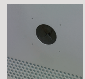
Passage de câble arrière de 50 mm.