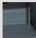
Ventilations hautes et basses