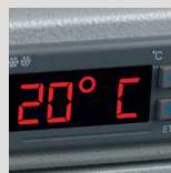
Thermostat (Premium). Permet le réglage de la température intérieure.