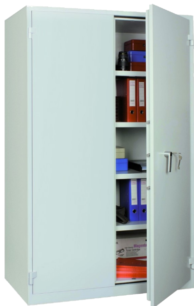
FF 100 E

Testées IMP EN 14450 S2 Assurable 3 000 € Blindage des organes de condamnation Construction en double paroi de 1.2 mm d'épaisseur Epaisseur des matériaux réfractaires 30 mm Epaisseur des portes de 60 mm inarrachables Diamètre des pènes 20 mm Ouverture de la porte 180° Serrure à clefs à double panneton en standard