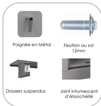
Poignée en Métal