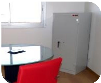
FF 90 A

Cette Armoire forte a été conçue pour ralentir la montée des températures à l'intérieur. La FIRST FIRE est ignifuge. Elle a été testée en usine et résiste à 500 degrés pendant 20 à 30 minutes et contre l'effraction IMP S2 soit une assurabilité de 3 000.00€. Alternative parfaite à l'armoire ignifuge 60 minutes pour les petits budgets! Son design s'intègre parfaitement dans l'environnement de vos