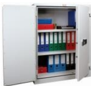
FF 90 B